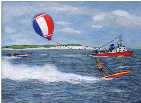
Richard John Wawro „Sporty wodne na kanale la Manche”, 1983 pastela olejna na kartonie, 36x50 cm