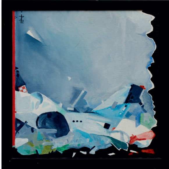
Iwona Fischer -Zuziak „XXX” akryl na płótnie, 33x33 cm