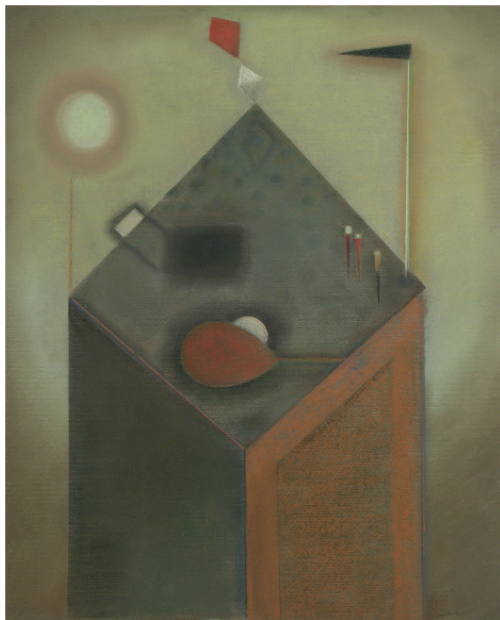
Wojciech Fabiański „Ucieczka latawców I”, 2013 suchy pastel, 63,5x74 cm, w oprawie: 73x63,5 cm