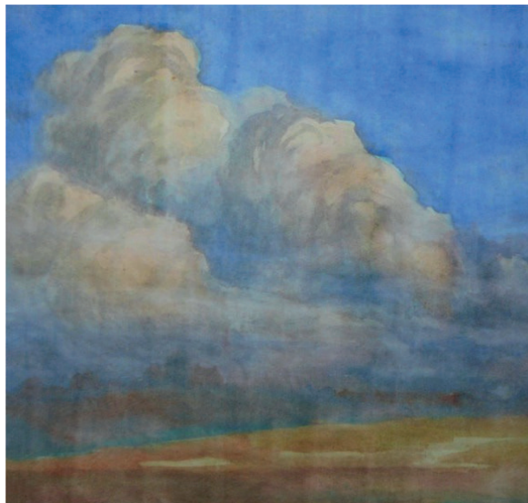
Rafał Karcz Pejzaż podkrakowski II”, 2022 technika mieszana, papier, 19x21 cm