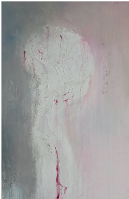
Manezha Dost „Nadzieja”, 2012 akryl na płótnie, 120x80 cm