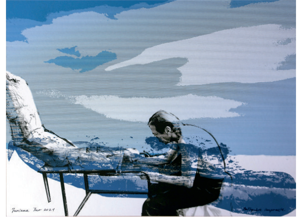
Juriana Jur „Bałtyckie impresje”, 2021 digital print, 30x40 cm