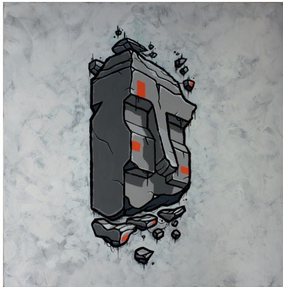
Simeon Genew „Artefakt 21”, 2021 akryl na płótnie, 50x50 cm