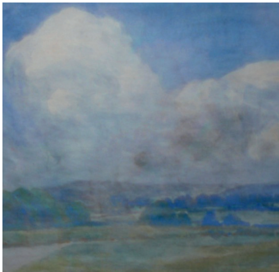
Rafał Karcz „Pejzaż podkrakowski I”, 2022 technika mieszana, papier, 19x21 cm