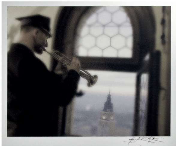
Henryk Tomasz Kaiser „Hejnał”, 2009 photoshop, 50x40 cm, w oprawie: 64,5x54,5 cm