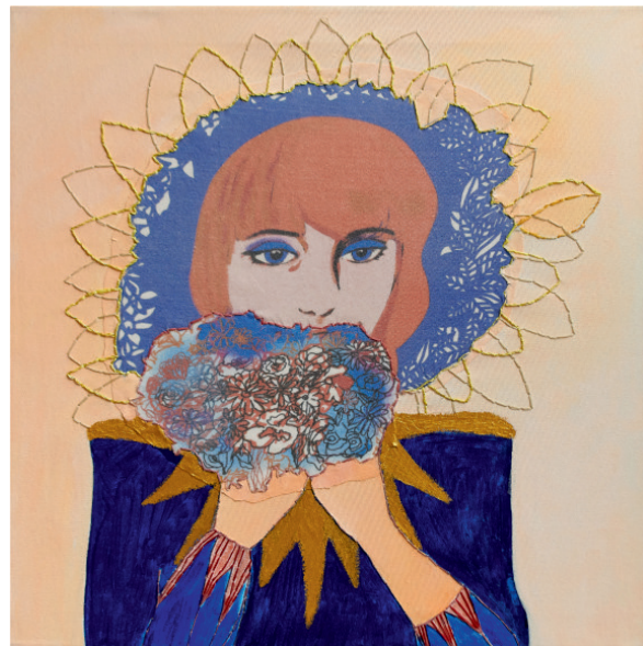
Aleksandra Kaleta „Pozytywna energia”, 2018 technika mieszana: materiał z własnym projektem nadruku, kordonek, mulina, farby akrylowe, 50×50 cm